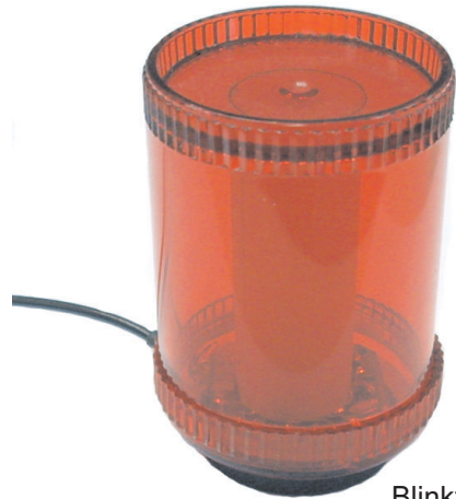
Blinkzylinder in Klebemontage

Die Gerätefamilie unserer Aktivanzeigen besteht aus einer Vielzahl von Teillösungen und Anpassmöglichkeiten.